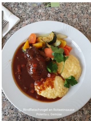
Rindfleischvogel an Rotweinsauce Polenta u. Gemüse